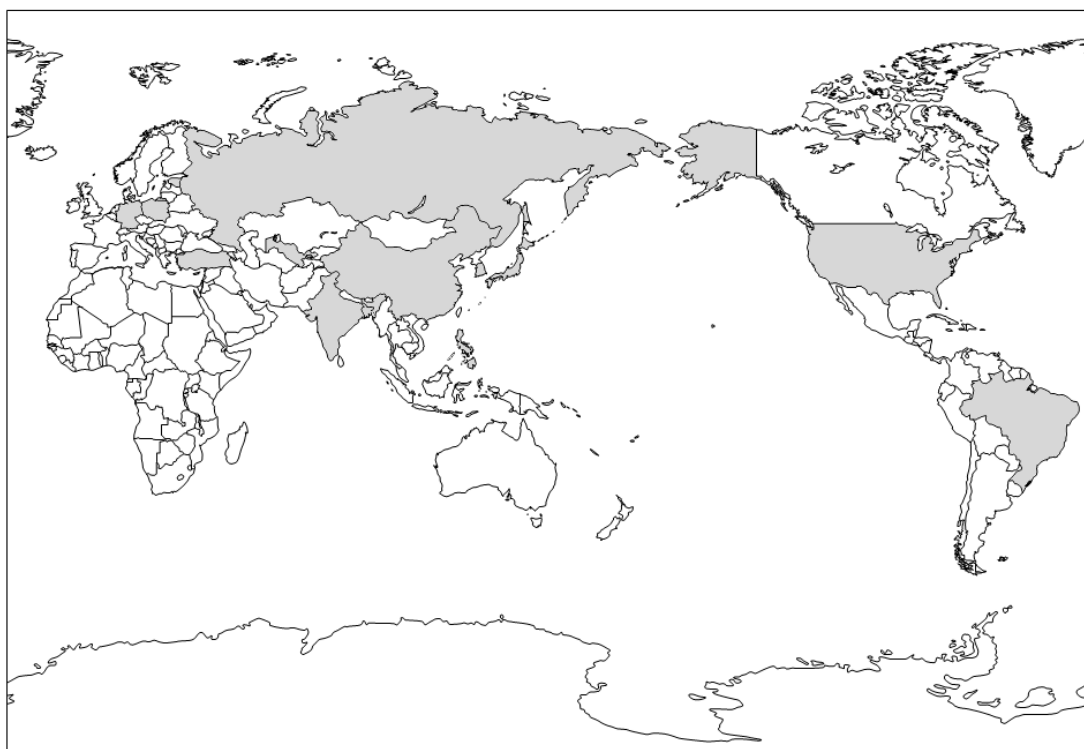
图 1 JIGS 项目的调查对象国（2013 年 12 月）

筑波大学于 1997 年组建了团体基础结构研究会，着手开展 Japan Interest Group Study 项目（简称 JIGS）。所谓 JIGS 项目，是通过向市民社会组织发放调查问卷，以日本为基点进行利益团体和市民社会的经验性国际比较研究。从 1997 年的日本调查（J-JIGS1）开始，截至 2013 年末，本项目共计对 15 个国家（其中日本 3 次，韩国和美国、德国、中国 2 次）的市民社会组织进行了调查（图 1、表 1）。